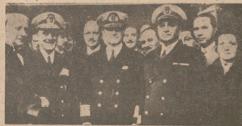
Como ministro plenipotenciario y enviado extraordinario de España para el acto de la toma de posesión del Presidente Perón, el almirante Moreno que llegó a la capital Argentina en el crucero «Galicia» fué recibido en los muelles del Plata por el embajador de España conde de Bulnes y el ministro de Marina argentino contralmirante Pantin

Nuevas y clamorosas manifestaciones de simpatía hacia España se produjeron en el estadio del «River Plate», donde la multitud que asistía al Campeonato de fútbol aclamó a la marinería de «Galicia», invitada al encuentro, al aparecer los tripulantes del buque de guerra español en las tribunas. Los marinos, emocionados, saludaron agitando sus gorras.—EFE.