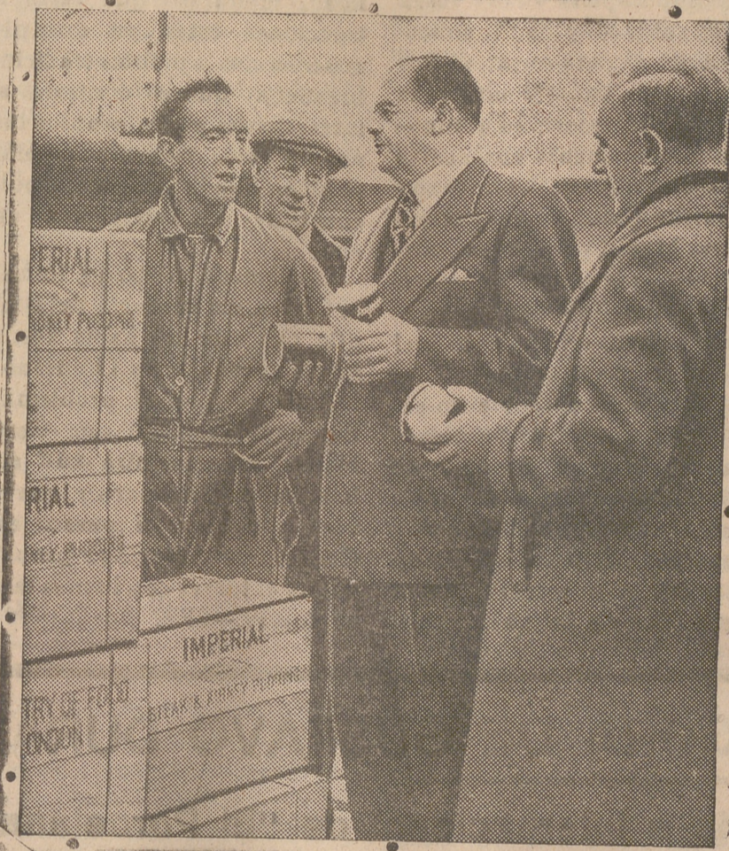
El Gobierno de la colonia inglesa de Victoria, en Australia, ha hecho un donativo en víveres consistiendo en 15.000 cajas de artículos varios. En esta fotografía vemos al representante de aquella colonia en Londres charlando con los obreros que tomaron parte en la descarga de la mercancía.

La Santa.—Del día 8 al 14 del corriente mes tendrá lugar una tanda de Ejercicios Espirituales para caballeros, y jóvenes, organizados por la Junta Diocesana de Acción Católica y el Consejo