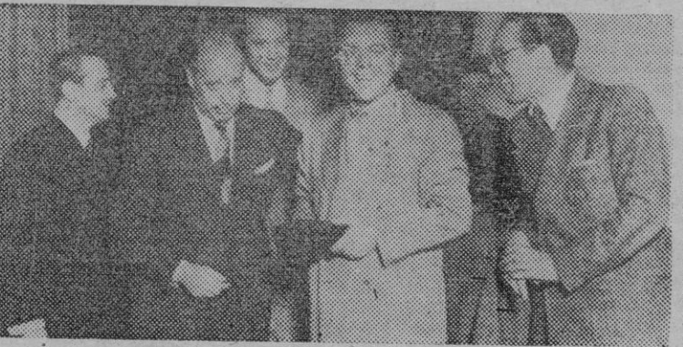
Madrid. — Se ha procedido al reparto de los premios que anualmente se otorgan a los mejores actores directores, guionistas, etc., en el cine Gran Vía de Madrid. El acto fué presidido por el Presidente del Circulo señor Viola acompañado de las primeras figuras de la cinematografía española.