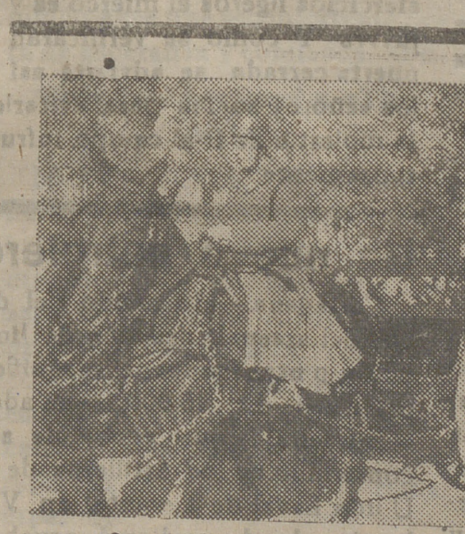
En el entierro del ilustre general Gómez Ulla, presidente del Colegio de Médicos de España y académico de la Real de Medicina, efectuado en el cementerio de la Almudena de Madrid, las tropas de Sanidad Militar que le rinden honores y nifas de los Colegios de Huérfanos. (S. O. F.)

MADRID.—El «Boletín del Estado» publicó ayer una orden del Ministerio de Industria y Comercio por la que se declara de absoluta necesidad nacional las centrales productoras de energía eléctrica en período avanzado de ejecución, cualquiera que sea su importancia, y aquellas otras que a pesar de haber sido iniciadas recientemente, interesan de es de ahora—por la elevada potencia de sus instalaciones y la favorable influencia que han de ejercer para resolver la actual crisis de escasez de energía eléctrica—asegurar la entrega de primeras materias y elementos con la máxima rapidez y regularidad para lograr los plazos de construcción más cortos posibles.