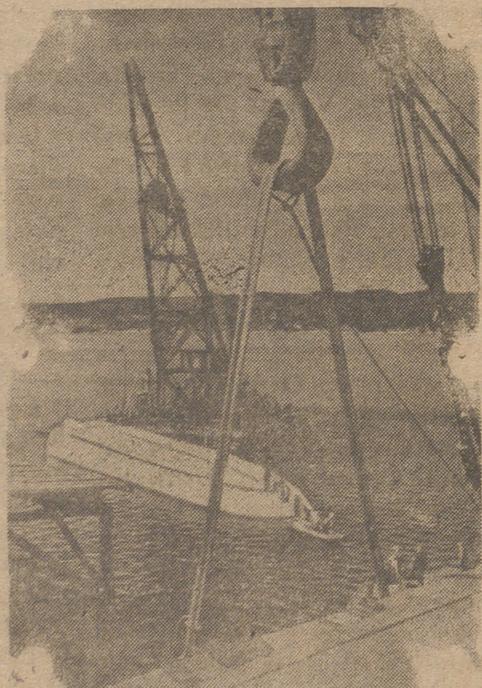
La nueva modalidad de construcción de barcos de cemento armado en Alemania ofrece grandes ventajas. En nuestra fotografía vemos un buque con la quilla hacia arriba preparado para darle la última mano de cemento.

mejor trabazón del cemento armado de hoy, todo hace, y obliga a ir reconociendo que el cemento está llamado a ser mucho más de lo que es hoy, y llegará hasta ser