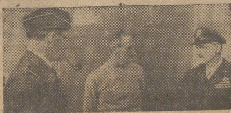
Los mariscales Montgomery y Tedder celebran una entrevista con el general Spats cerca de la frontera germana

PARIS, 12.—Ha aumentado la actividad de las bombas volantes sobre la zona del noveno ejército. Estas bombas volantes siguen una trayectoria diferente a la usada en las últimas semanas, lo que se atribuye a que los alemanes deben haber trasladado sus bases de lanzamiento ante los nuevos avances aliados.—EFE.