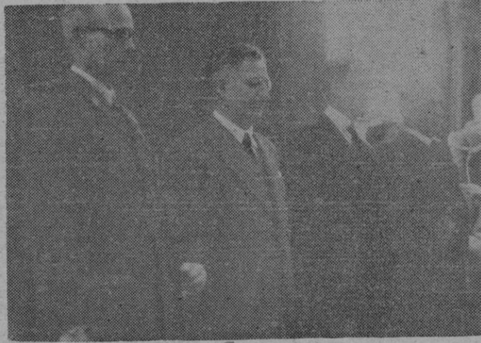
El Excmo. Sr. Ministro de Industria y Comercio, juntamente con el Excmo. Sr. Capitán General y Gobernador Civil, durante la brillante recepción celebrada ayer en el Ayuntamiento.