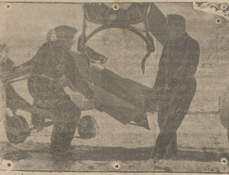
En el aeropuerto el Stuka alemán recibe las bombas para proseguir después sus ataques contra el enemigo.

La U. R. S. S., al margen de la Diplomacia, prepara su invasión comunista, que es la revolución universal.