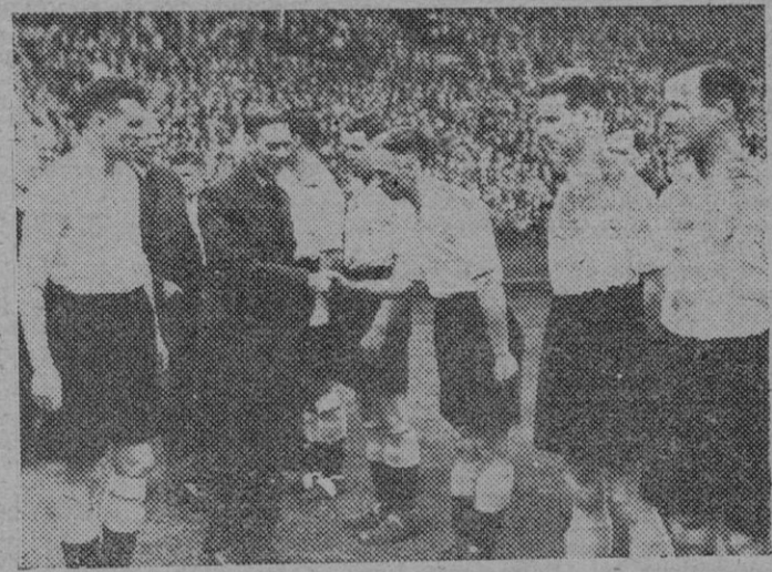
Antes de comenzar el partido final de la Copa de Inglaterra, el Rey Jorge saluda en el Stadium Wembley, a los componentes del Derby Country ganador de la Copa. Este equipo derrotó después de una emocionante prolongación del encuentro, al Charlton Athletic por 4 tantos a uno.