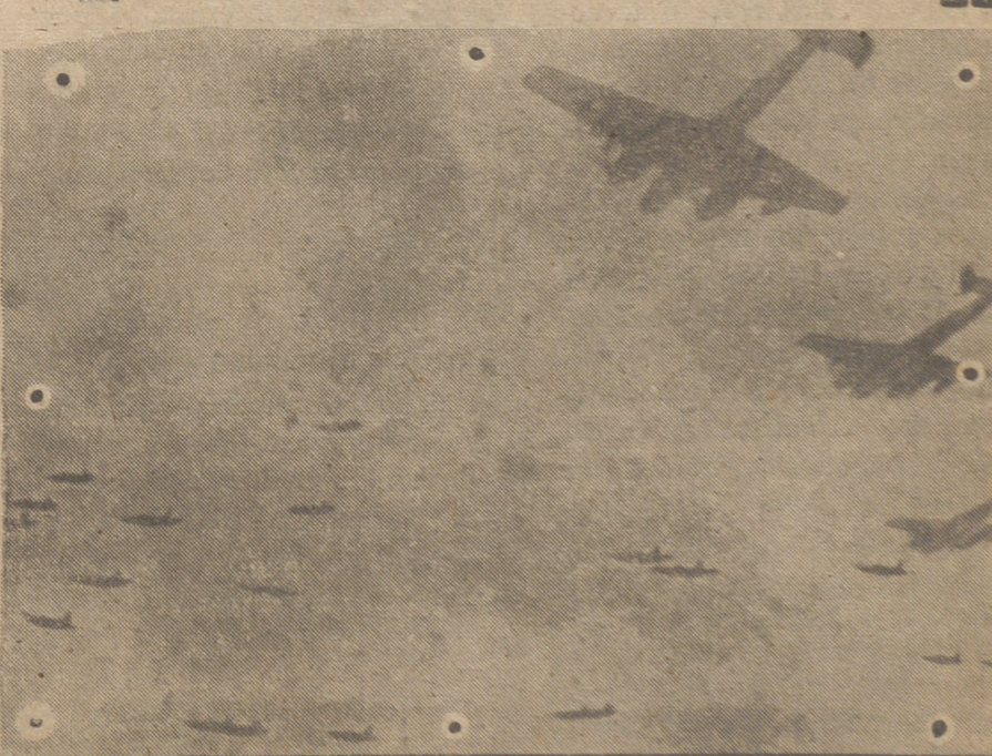
Los aviones destructores alemanes han avistado los bombarderos angloyanquis de terror y comienzan el ataque contra las fortalezas volantes. Una impresión fotográfica de la lucha.