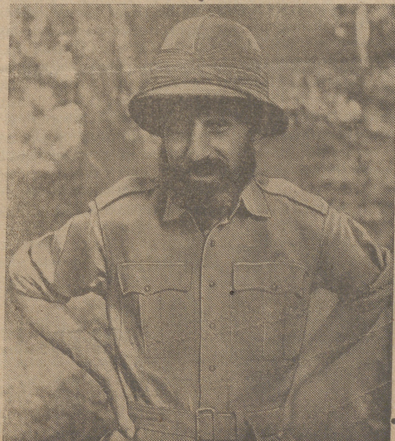
El general Wingate, que dirigió a un gran destacamento inglés contra las líneas ocupadas por los japoneses en Birmania y más tarde regresó a su base de partida, la India.

La Conferencia se tendrá el jueves próximo, 13 de Abril, a las 7,30 de la tarde, en el Instituto de Enseñanza Media.