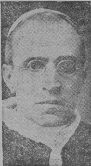
S. S. EL PAPA PIO XII

Además se está cotando a todo elitoral español de un sistema moderno y eficaz de senales tanto luminosas como de otros sistemas, instalación esta en que se tienen en cuenta los últimos adelantos y la enorme importancia de la aviación; por ello muchos de los faros — los que tenían un alcance superior a las 20 millas — se han convertido en aeromarítimos.