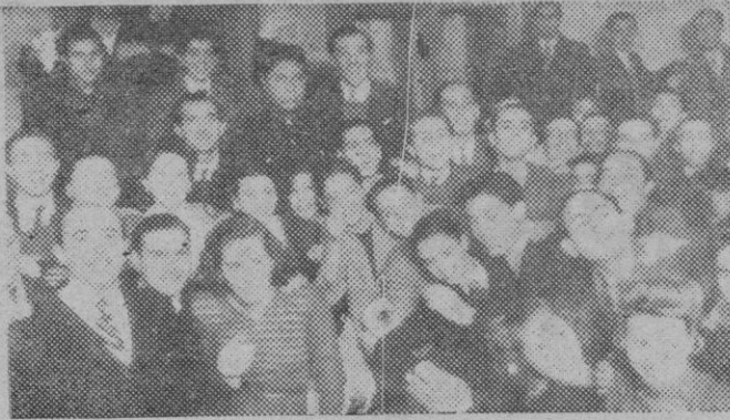
El personal de la misma Compañía que resultó agraciado con el premio mayor de la lotería. Sonrisas, abrazos, promesas, el "reporter" se ve materialmente estrujado entre la inusitada alegría de este personal modesto, agraciado con el mayor regalo de Pascuas.