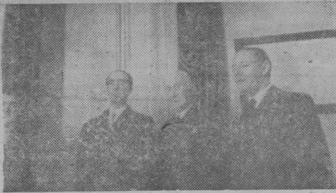
El Director de la Compañía Comisariado Marítimo de Seguros y dos funcionarios que han sido agraciados con una gran participación del "Gordo".