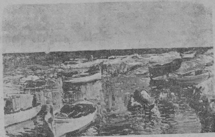
"La Caleta", magnífico cuadro de Ramón Nadal, que ha figurado en su exposición del "Círculo de Bellas Artes".