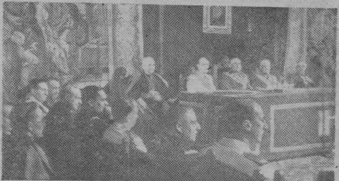
El Caudillo, acompañado del Gobierno y altas personalidades eclesíásticas y civiles, clausuró la VI Sesión Plenaria del Consejo Superior de Investigaciones Científicas