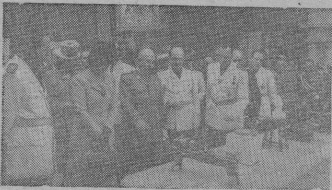
S. E. el Jefe del Estado, acompañado de su esposa, y del Ministro de Educación Nacional, con otras autoridades y personalidades visita la Exposición Nacional de las Escuelas de Artes y Oficios de España.