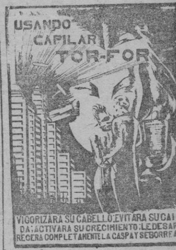
VIGORIZA SU CABELLO. EVITA SU CAÍDA. ACTIVARA SU CRECIMIENTO. LE DESARROLLA COMPLETAMENTE LA CASPA Y SEBORRÉA