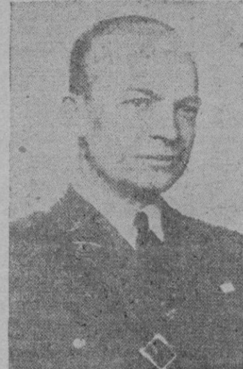
EL GENERAL EISENHOWER

La cifra de explosivos lanzados sobre el Japón durante el presente mes asciende a 17.500 toneladas. Los objetivos alcanzados en este ataque han sido ciudades de menos de 200.000 habitantes y de ahora en adelante serán atacados los centros aún más pequeños, pero no por ello menos importantes, ya que Tokio, Osaka y Nagoya, así como los otros centros de mayor importancia, han quedado eliminados como objetivos, debido a las grandes destrucciones causadas en incursiones anteriores.