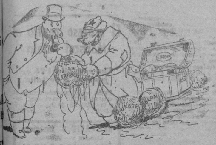
Está visto que este tio no hace más que sacar lies.