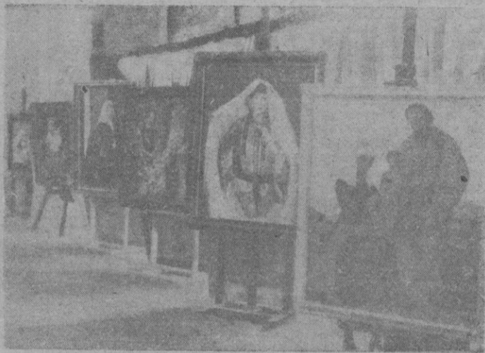
Otro aspecto parcial del salón de La Lonja, donde quedará instalada la espléndida exposición artística.

talación continúan a ritmo acelerado. Pasado mañana, Dios mediante, podrá ser inaugurado el magno certamen, que constituirá — el cobijario — un auténtico orgullo para nuestra ciudad.