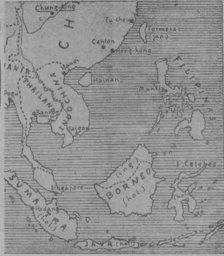
Mapa de las Indias Orientales Neerlandesas, donde se puede apreciar la situación de Borneo respecto a las Filipinas y al S-E asiático

de Borneo, cuyo desembarco comenzó el sábado por la mañana, dirigido por Mac Arthur.