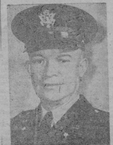
El General Eisenhower

órdenes han luchado y trabajado por conseguir la victoria y