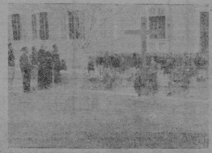
La oración ante la Cruz de los Caídos, durante la clausura celebrada el viernes.