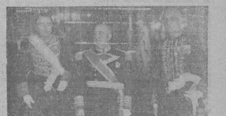
Su Excelencia el Jefe del Estado, entre el Ministro de Asuntos Exteriores y el nuevo Embajador italiano en España.