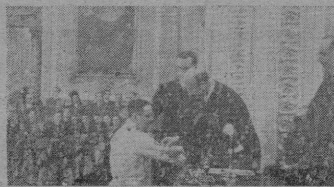
Presidido por el General Aranda se celebró en el Casino de Madrid el reparto de premios a los ganadores del Campeonato de España de esgrima de los maestros de armas. El camarada Hildebrand entrega una condecoración al ganador