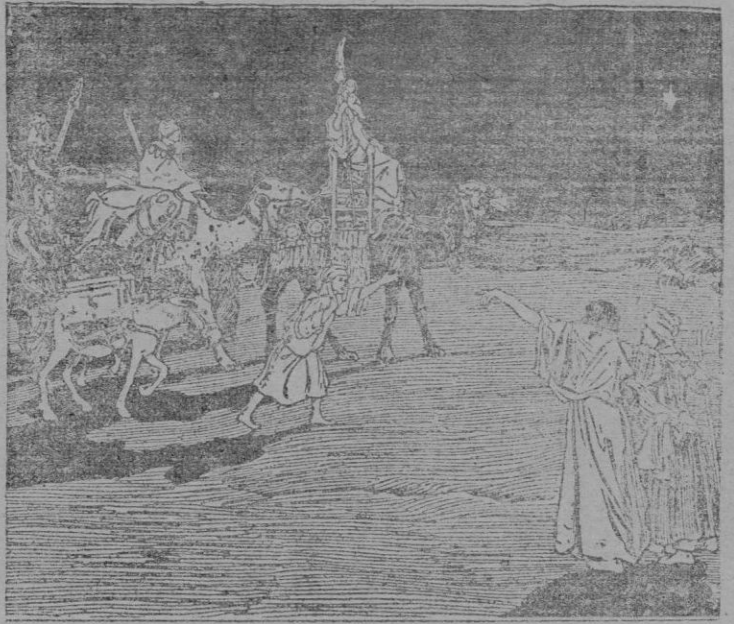
Vastas soledades cruzaron los Magos en busca de la cuna del Niño-Dios