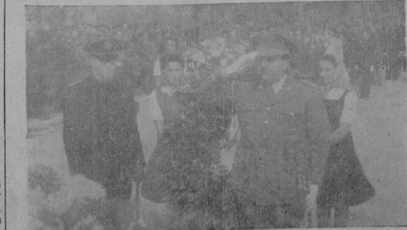
La ofrenda de coronas, por los Excmos. señores Capitán General y Gobernador Civil-Jefe Provincial del Movimiento