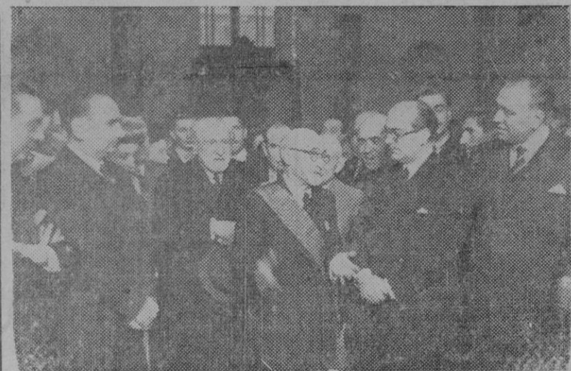
En el homenaje nacional celebrado en honor de D. Jacinto Benavente se le impuso la Gran Cruz de Alfonso X el Sabio por el Ministerio de Educación Nacional, en presencia de el Ministro Secretario General del Movimiento y del de Justicia