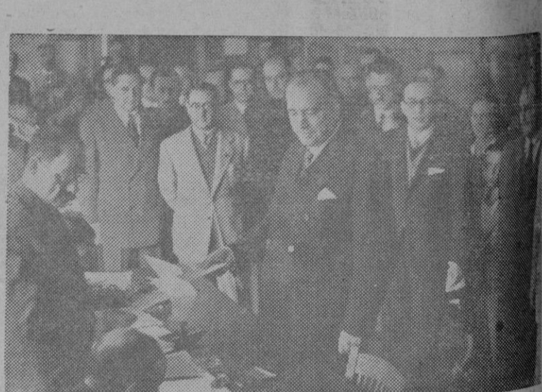
El Ministro de Justicia, emite su voto como periodista en la Asociación de la Prensa madrileña