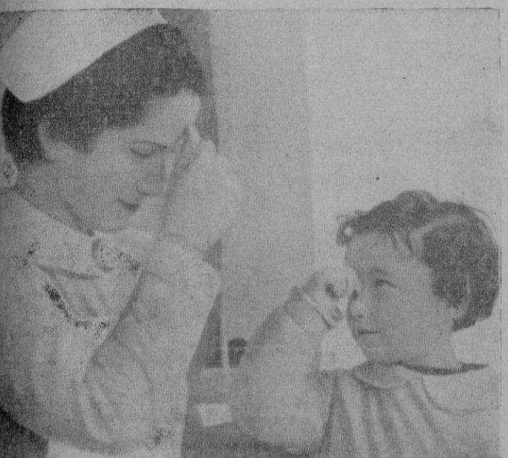
Esta bella estampa se ve a menudo en los centros de "Auxilio Social", en los cuales también se enseña a los pequeños a amar a Dios.