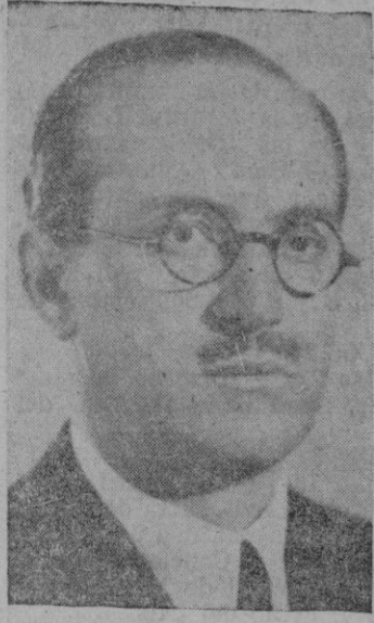
El Excmo. Sr. Ministro de Educación Nacional, don José Ibáñez Martín

que trató de la creación de la Universidad "Menéndez y Pelayo". Después usó de la palabra el tan