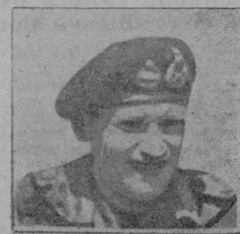
El Mariscal Montgomery

Gran Cuartel general del cuerpo expedicionario aliado. — Comunicado: "Ruan ha sido ocupado por las tropas aliadas. Las fuerzas canadienses han cruzado el Sena al oeste de la ciudad y se han adueñado de la región comprendida entre Oudabec y Lillebon. La cabeza de puente de Amiens ha sido ampliada a lo largo del Somme, hacia las inmediaciones de Corbille. La península de Daculas, al sur de Brest, ha quedado libre de alemanes. Las tropas norteamericanas avanzan sobre Compiègne a través del bosque del mismo nombre".