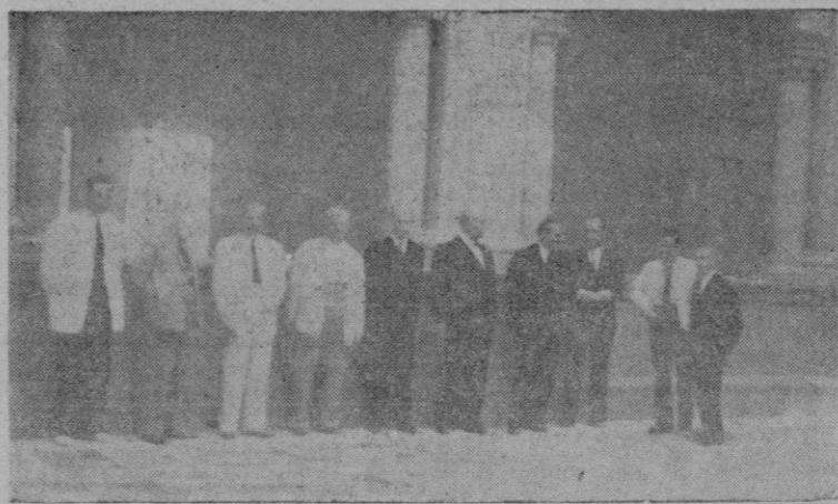
Los asistentes al acto en el vestíbulo

hoy, continúan realizándose todavía en centrales de condiciones deficientísimas. Afortunadamente, esto va acabándose y en breve plazo, gracias al buen deseo de los Altos Poderes del Estado