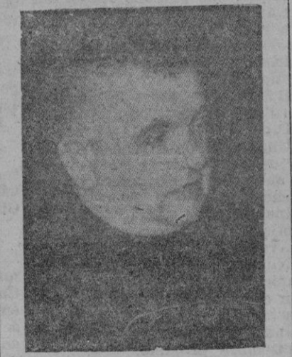
Monsenor Tiso, Jefe del Estado eslovaco

han divulgado la falsa noticia del pretendido asesinato del Presidente del Estado y la deportación del gobierno por los alemanes.