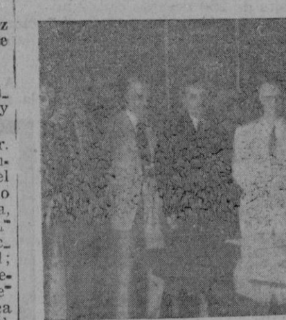
Momento de la entrega del edificio por el Excmo. Sr. Gobernador Civil a los Cuerpos de Comunicaciones

que dominaba el más alto patriotismo entre las autoridades y pueblo de Mallorca, señalando el hecho como un paso de gigante