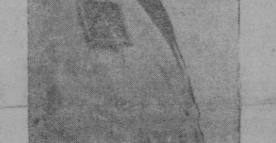
El Excmo. Sr. Ministro Secretario General del Movimiento

Fero no; la doctrina de la Falange no necesita ser rotocada ni para darle ese complemento que echan de menos los que no nos conocen ni menos aún para doblar nuestra