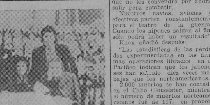
Madrid.—Las hijas de los periodistas preparan la exposición de juguetes de la Asociación de la Prensa.

Washington.—El Secretario para la Marina, Coronel Knox, declaró ayer: "La flota japonesa espera solamente el momento para salir de sus bases y librar batalla contra las fuerzas norteamericanas."