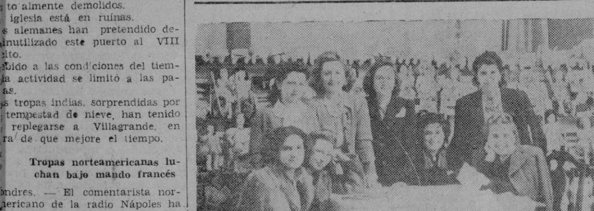
Madrid.—Las hijas de los periodistas preparan la exposición de juguetes de la Asociación de la Prensa.

Del comunicado alemán revelado que tropas regulares del ejército norteamericano combaten bajo mandos franceses en el sector francés del V ejército.