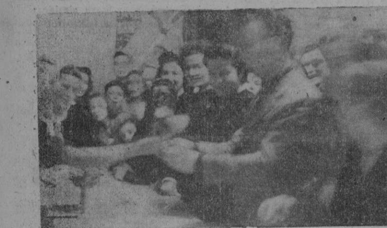
El Excmo. Sr. Gobernador Civil y Jefe Provincial del Movimiento juntamente con su distinguida esposa adquiriendo billetes de la rifa.