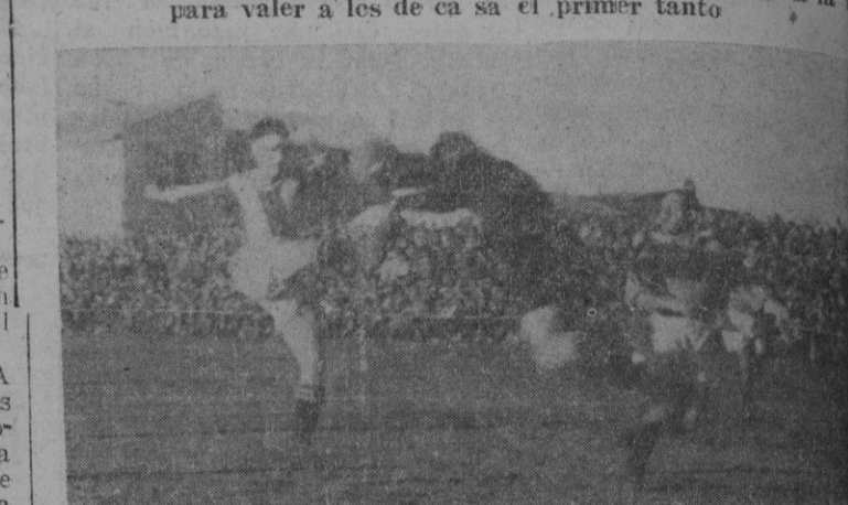
El guardameta leridano intercepta valientemente una jugada Albella muy peligrosa