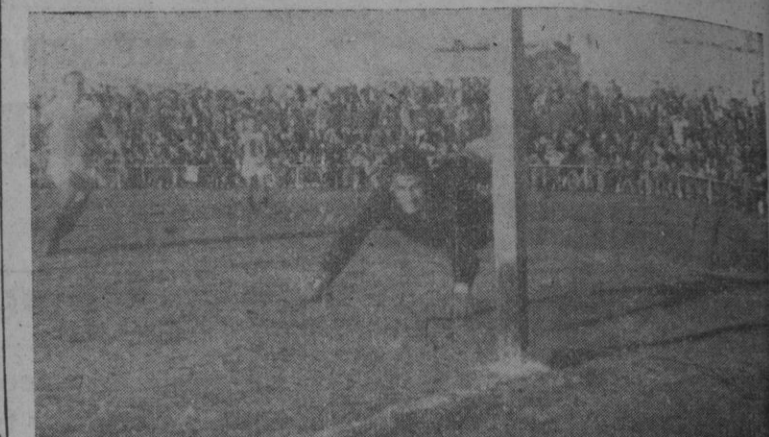
Pese al estirón del meta catalán, el tiro de Albella llega a la meta para valer a los de casa el primer tanto