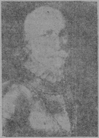
Don Alvaro de Bazán, marqués de Santa Cruz, almirante de Castilla, una de las primeras figuras de la Marina española

(Texto y fotografías de CIFRA) Fué la Reina Isabel II quien inauguró el Museo Naval, ahora hace cien años, el 19 de Noviembre de 1843.