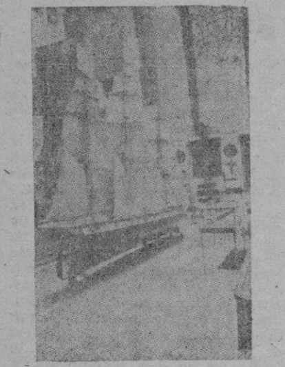
Detalle de uno de los salones del Museo Naval de Madrid

A los pocos años, las instalaciones se trasladaron a la Plaza de los Ministerios, al edificio del Ministerio de Marina, en el Palacio de Godoy.