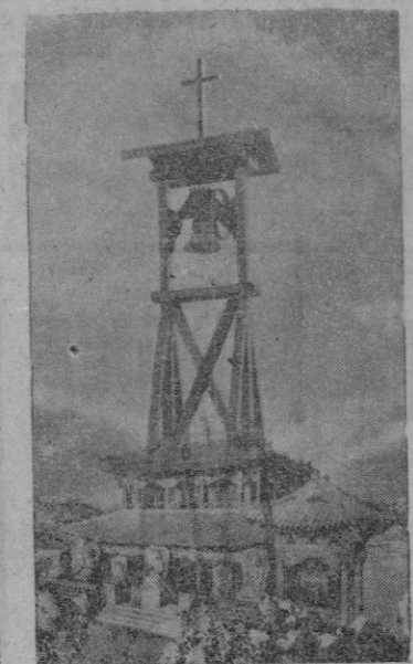
Cuatro palos sostienen la campana y la cruz. He ahí todo el menaje con que un misionero llama a los gentiles hacia Dios. No cabe mayor miseria. Pero esa cruz y esa campana y esa miseria misma tenazmente soporata, acaban por erigirse sobre los fabulosos templos antiguos donde los dioses del paganismo yacen solitarios en sus nichos de oro

El 5.º ejército se dispone a desencadenar un gran ataque en la llanura de Capua y las fuerzas del Mariscal Kesselring efectúan los preparativos nece-