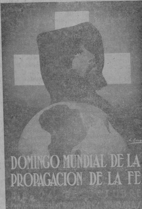
DOMINGO MUNDIAL DE LA PROPAGACION DE LA FE

El problema de las razas quedará resuelto en esta jerarquía de color cuya cifra de sacerdo-