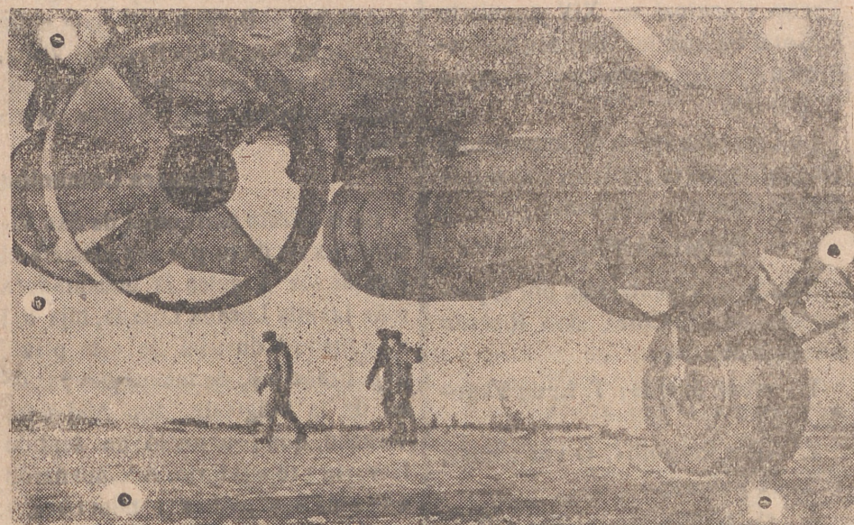
Un avión alemán He-111 se dispone a realizar un vuelo contra el enemigo llevando a bordo dos gigantescas bombas de mil kilos.

dos daños y hubo varias víctimas resultando algunas personas muertas. Tres de los aparatos incursivos fueron derribados por la D. C. A. y en otro por nuestros cazas. Ayer noche fueron arrojadas bombas en un distrito costero de Inglaterra oriental por unos doce cazas bombarderos. Fueron provocados algunos daños y hubo muertos y heridos.—EFE.