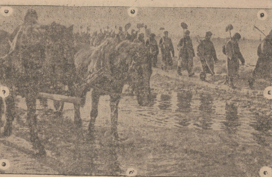
El deshielo en el frente del Norte de Rusia produce grandes inundaciones y los caminos se hallan intransitables. Esta columna de aprovisionamiento alemán tiene que vencer grandes dificultades para llegar a su punto de destino..