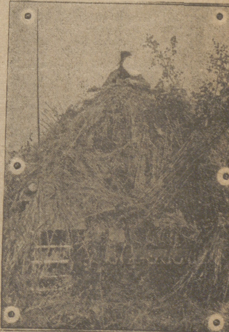
Un tanque alemán camuflado de ramaje en servicio de descubierta en un sector de combate del frente del Terek