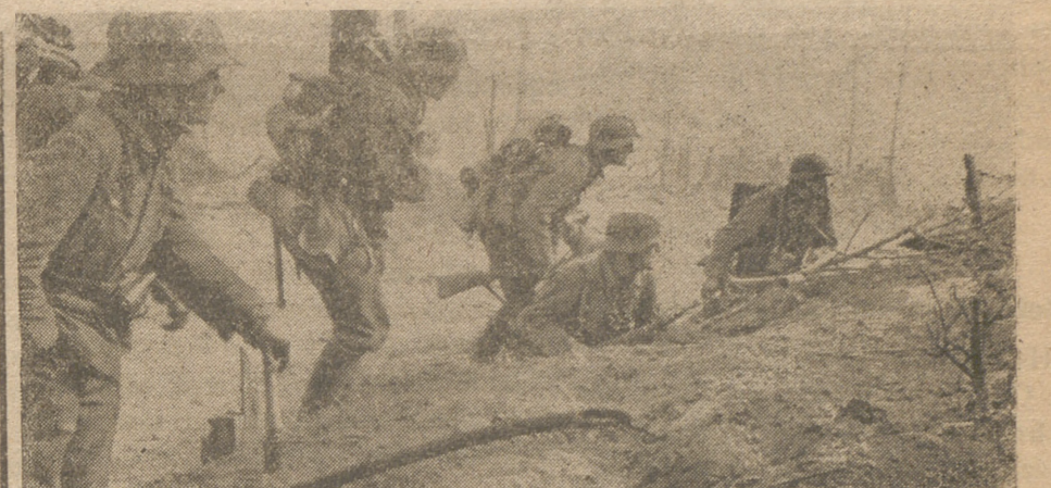
ATAQUE EN EL ESTE.—Infantes alemanes durante una peligrosa fase de la lucha, atacando un pueblo soviético alrededor del cual hallanse numerosos paisanos escondidos

EL PANORAMA GENERAL, según la opinión autorizada de los críticos: La zona Don-Volga y el norte de África, desde Bizerta al golfo de Sirte,