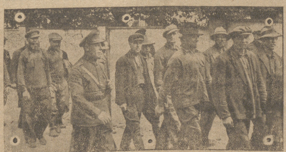
UN PUEBLO QUE SE LIBERA DEL BOLCHEVISMO.—A las pocas semanas de guerra en el Este, los países bálticos se vieron libres de la pesadilla del bolchevismo. Letonia destacó más que nadie en la acción por quitarse de encima la pesadilla comunista. Rápidamente quedó organizada la Legión Patriótica Letona, y ésta vigila ahora a los que fueron antes comunistas. En la foto, un grupo de comunistas, obligados a trabajar, es conducido por miembros de la Legión Letona, a los lugares de trabajo.

perdió todo su ajuar y fué a acogerse al refugio instalado en el Colegio Cantábrico. Luego vivió en distintos refugios haciendo una vida muy precaria. En Santander era muy popular.—CIFRA.