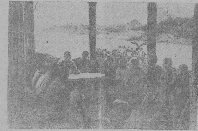
La clase al aire libre, en una terraza asomada al gozo de nuestra bahía, tiene entrañable tono de familiaridad

Mar y pinos, tierra y jardines, veredas y rincones que invitan al sosiego y al estudio, a la buena vida para el cuerpo y para el espíritu, para el corazón y la mente.