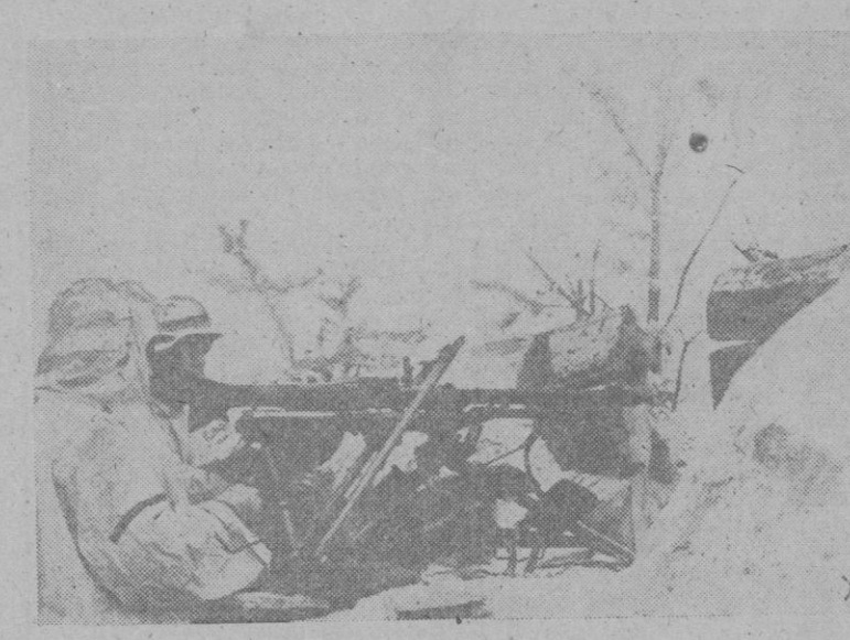
Puesto alemán de antitrallador a asegura su posición en primera línea; los hombres se hallan camuflados de blanco para pasar inadvertidos en la nieve