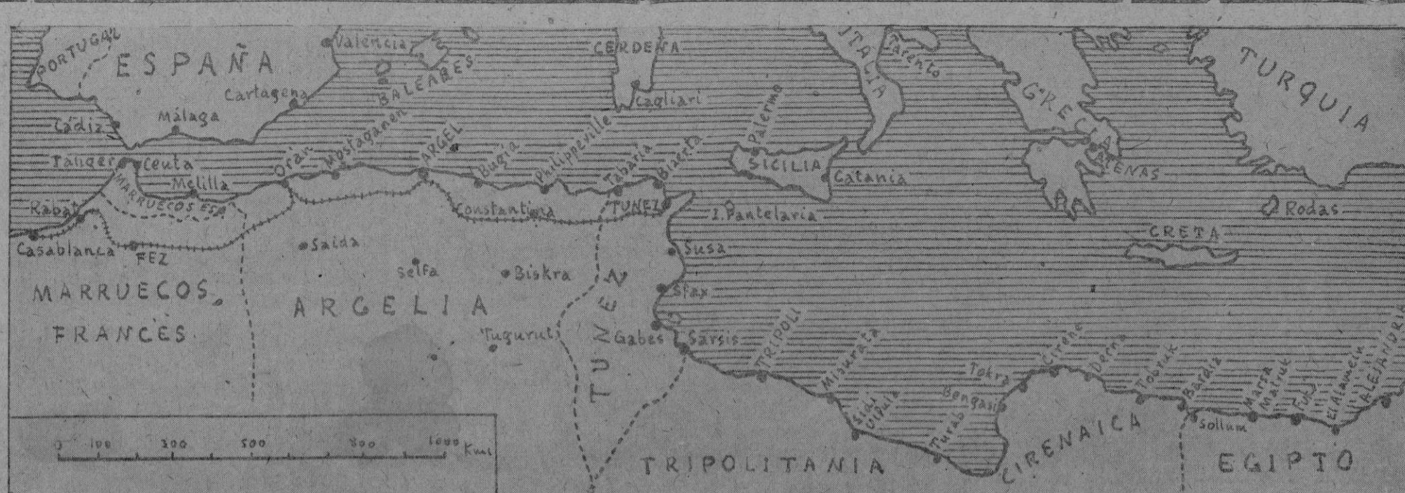
Mapa del Norte de África y del Mediterráneo

El hijo del Ministro británico de la Defensa, que se encuentra en la capital alemana, se dirigirá hoy por radio a los compatriotas durante la noche en lengua inglesa. Amery residirá en el regimiento de la 1.ª División y entrará a formar parte de las tropas alemanas que se dirigen a la zona de la frontera para trasladarse al este del Reich. EFE