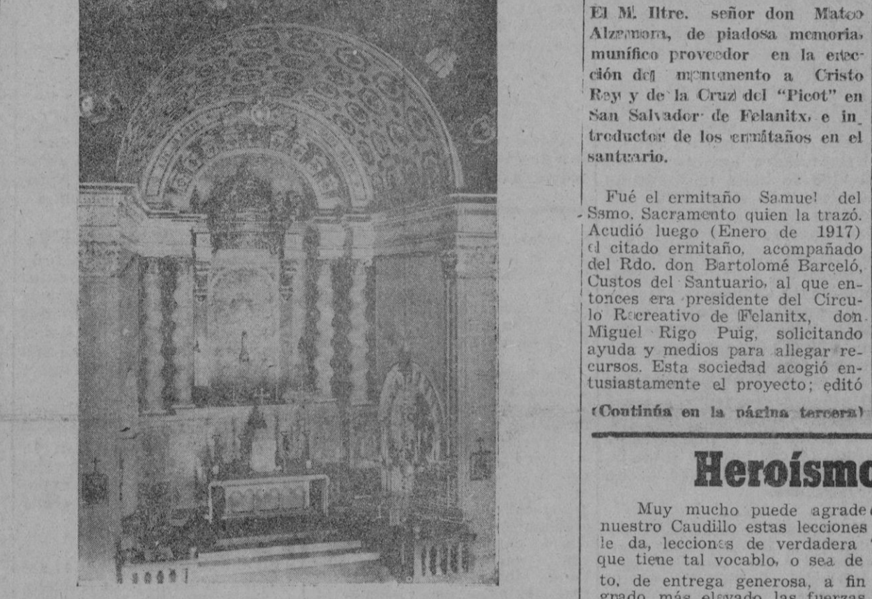
Aspecto general del artístico y rico presbiterio y retablo que serán bendecidos el próximo domingo en el Santuario de San Salvador de Felanitx.

Cincuenta años cúmplense ahora de la instalación de los ermitaños de San Antonio y San Pablo en el Santuario de Nuestra Señora de San Salvador de Felanitx, y con tal motivo y en conmemoración asimismo del VIII aniversario de la coronación pontificia de la sagrada Imagen que desde aquel monte otea parte de la llanada mallorquina, se celebrarán solemnísimas fiestas el próximo domingo, día 11 de Octubre. Ocasión es ésta para poner de relieve el esplendoroso resurgimiento logrado en aquel santuario gracias a las actividades y desvelos de la comunidad eremítica, y las positivas ventajas que para comodidad de los peregrinos y para auge de la devoción a la vetusta Imagen se han recabado. El estado del edificio en 1891 era ciertamente lamentable; bastó decir que en el primer año de estancia de los ermitaños, colocaron éstos en los tejados del santuario más de 18.000 tejas. Poco tiempo después embellecieron el templo con revoque imitando sillares de San Garau. No son fáciles de enumerar las mejoras introducidas por la piadosa y ejemplar comunidad en la hospedería, en las celdas, en los muebles y enseres; mejoras que por otra parte están a la vista de cuantos peregrinos suben a aquel monte mariano en demanda de un beneficio o en acción de gracias por una dádiva recibida. Han dotado asimismo el santuario de modernos pararrayos y de teléfono. En fin, la limpieza y pulcritud que se nota en todas las dependencias, el trato afable y esmerado que dan los ermitaños a los peregrinos,