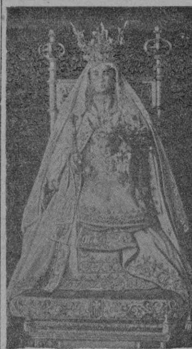
A la Madre de Dios bajo la advocación de la Merced, Madre y Fundadora de la Orden Redentora de Cautivos y Patrona de Barcelona, rinde hoy el mundo entero devoto homenaje de filial amor.