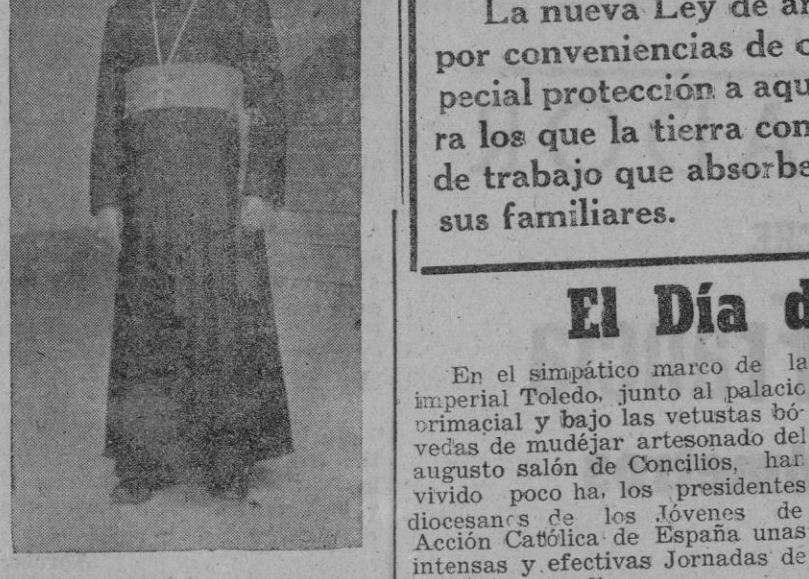
El Excmo. y Rdmto. Mons. Emílio Lissón, Arzobispo titular de Methymna

ble a España la Patria madre y lo han demostrado en repetidas ocasiones. Cuando se celebró el centenario de la independencia del país, fueron invitadas a las solemnidades conmemorativas todas las naciones, mas a España se dió la presidencia en todos los actos. Otro detalle. En el primitivo himno nacional había unas estrofas que herían la susceptibilidad de la madre Patria; pues el Congreso decidió fueran aquellas suprimidas. Además, según un artículo de la nueva Constitución, los españoles pueden nacionalizarse peruanos, mas no por ello pierden la nacionalidad primitiva. —¿...? — Mis planes? Ya le he dicho: contentísimo de encontrarme en España y de ayudar en lo que de mi parte está al venerable Arzobispo de Valencia, y siempre en manos de la Providencia. —¿...? — Y nos despedimos seguidamente del Excmo. y Rdmto. Monsenor Emílio Lissón después de besar reverentemente su anillo pastoral. Vosotros, los productores españoles, veniais clamando en lo que va de siglo contra la falta de un puesto y de un lugar para vosotros o los organismos institucionales, para que las actividades nacionales pudiesen ayudar a engrandecer a la Nación. Y hoy os hemos abierto ese canal y os ha enfrentado con una responsabilidad, pero al haberlo he de recordaros lo que contraís y la necesidad de que hermanéis vuestros propios intereses con los supremos de la Patria. (Del discurso del Caudillo en la inauguración de la Escuela de Formación Profesional).