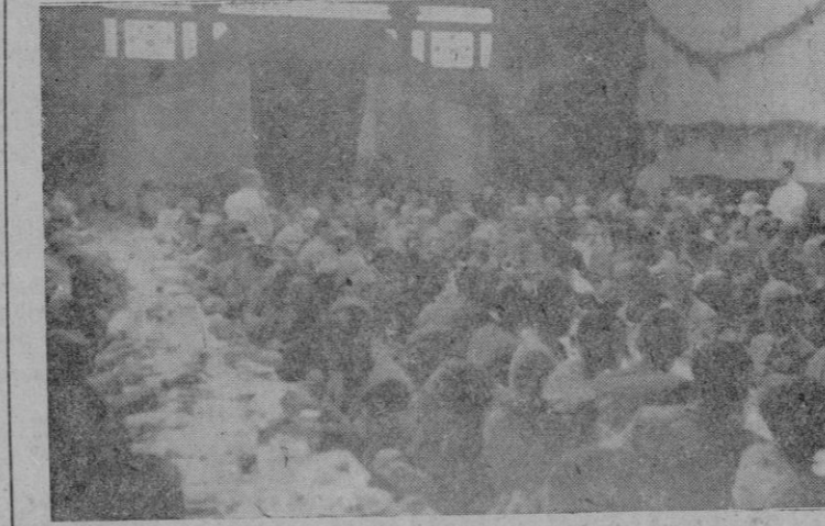
Los salones del que fué Gran Hotel durante la comida de hermandad