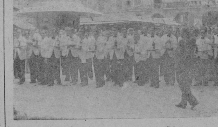
Los camareros, instantes antes de la salida para su carrera en la Plaza del Marqués del Palmer.

«con un magisterio de costumbres y refinamientos, de tal manera que todos unidos tengan una meta común, que dejando a un lado rencillas, egoísmos, o privilegios, no piensen más que en un Dios, en una Patria y en un Caudillo, que sea nuestro Yugo y Flechas, símbolo de unidad de la España de Isabel y Fernando, de la España del Escorial; bajo nuestra bandera roja que la sangre y negra como el dolor; bajo aquella otra guardadora de las más puras esencias tradicionales de España; bajo nuestro invicto Caudillo, Ca-