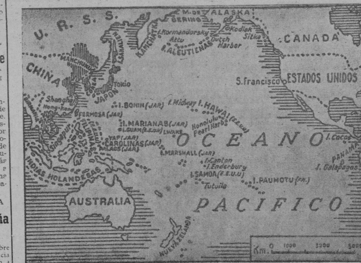
Mapa de la región norte del Pacífico, teatro de la nueva lucha en tablada entre el Japon y los Estados Unidos

EL ALEMÁN Cuartel General del Führer. Comunicado: "Los ataques locales del ene-