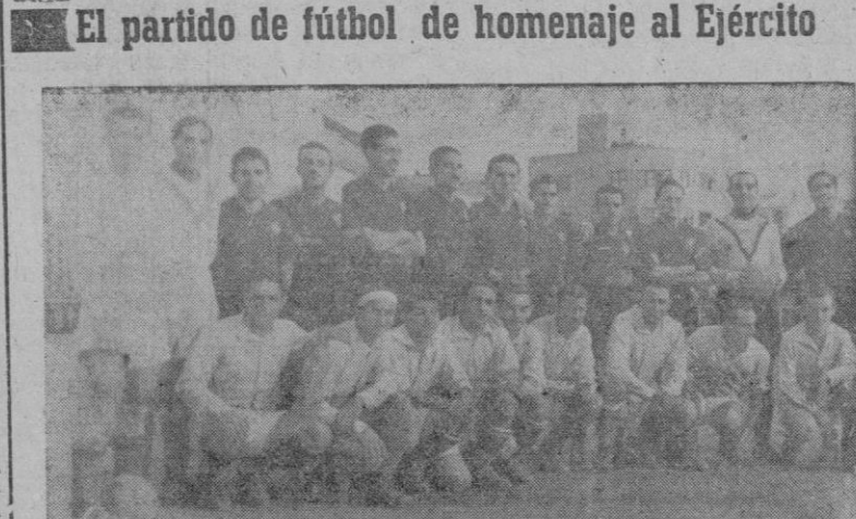
El partido de fútbol de homenaje al Ejército