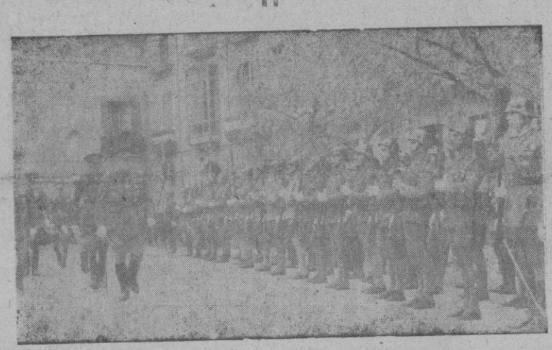
El Capitán General pasando revista a las fuerzas de Infantería antes de la misa