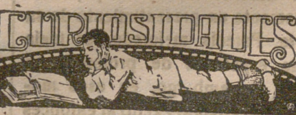
La música en el Japón

H y en este país cuatro clases de músicas: la primera está compuesta por los que ejecutan la música religiosa; la segunda, por los que ejecutan la profana; la tercera, por ciegos, y la cuarta por mujeres.