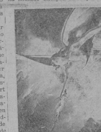
Un tercer detalle. — Un pasajero divino muestra un página conmemorativa de la definición dogmática de la Inmaculada Concepción por Pío IX, y al propio tiempo se agrita con brazo fuerte espada fulgurante con que destruye las herejías y racha en los abismos los peñidos capitales.

Muy pronto sus religiosos instituyeron una fiesta en honor de su celestial Fundadora y Abogada, como recuerdo de su Aparición — Festum Descensionis B. M. V. de Mercedes, como se ha titulado siempre en España.