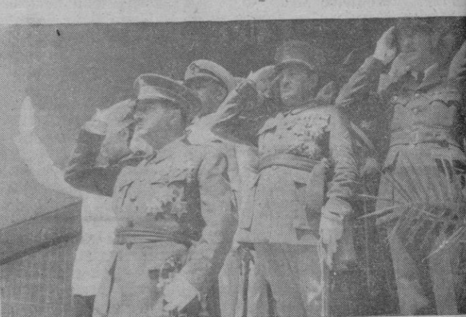
El Capitán General, Gobernador Civil y Gobernador Militar, presenciando el desfile de las fuerzas de la escalinata de Capitanía General.