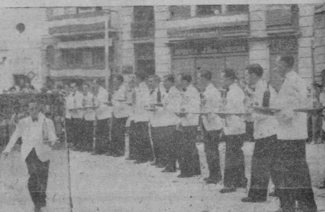
Los detalles de la carrera de camareros que se efectuó