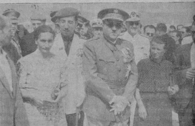
El Capitán General y el Gobernador Civil rodeados de los matrimonios que han obtenido el premio de natalidad de Baleares.