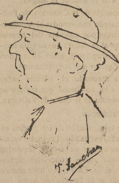
imagen. Véase sino en esta que nadie podrá pedir la identificación porque la personalidad, ya fallecida, si no hablando, como vulgarmente se dice está bien recogida.