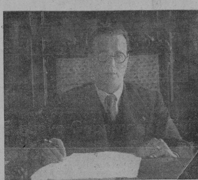
El Excmo. Sr. D. Fermín Sanz Orrio, en su despacho oficial, poco después de haber tomado posesión de su cargo.