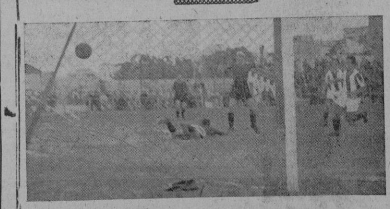
Del "Mallorca" - "Balears" de ayer: el primer tanto de la tarde, logrado por Borrás.