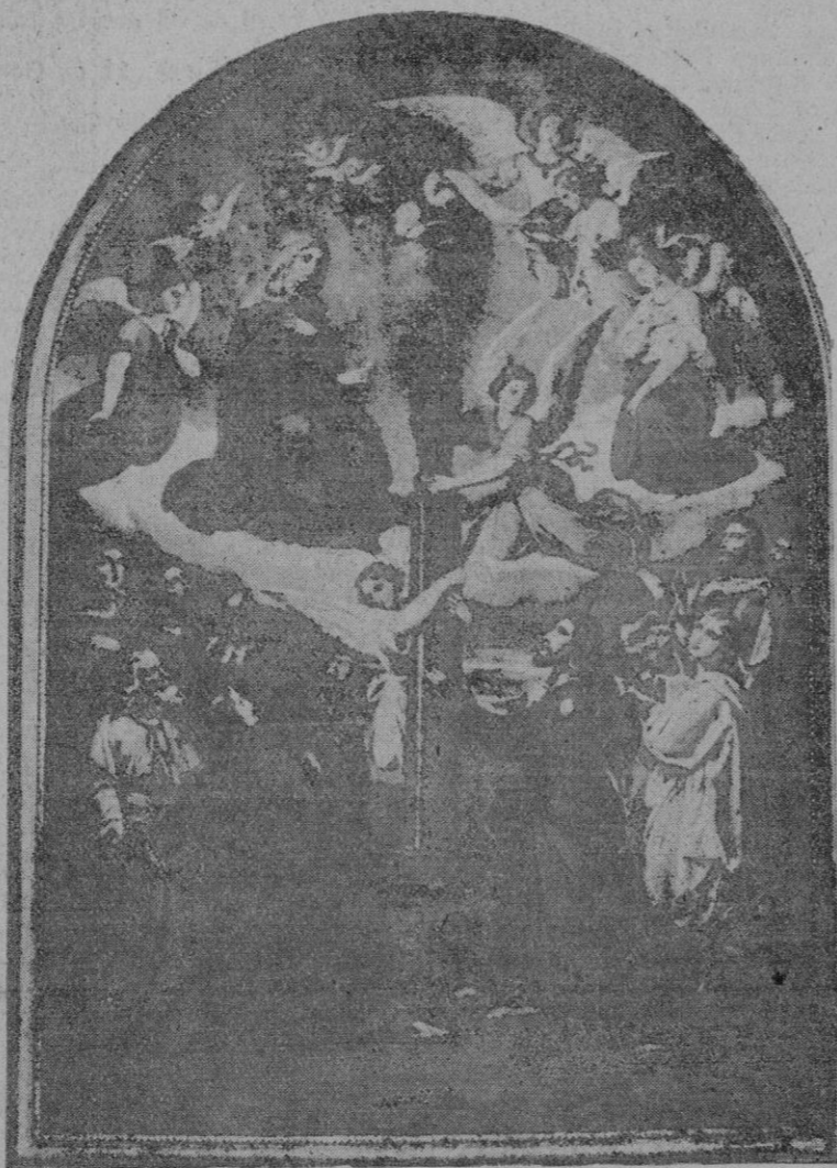
La aparición de la Virgen a Santiago.

En estos momentos en que nuestros camaradas fascistas renuevan en tierras africanas, la heroica tradición de nuestras armas de que V. E. es el más esforzado paladín, quiero expresaros toda la solidaridad que