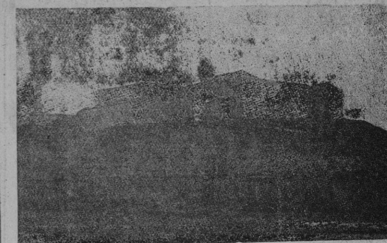
El convento de la Rábida

objetos de oro, papeletas de empuño, cambio alhajas nuevas por otras viejas. Vidriera, 27, entransada de 10 a 1 y de 4 a 8.