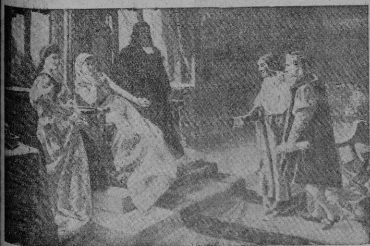
Colón es presentado por primera vez a los Reyes Católicos. (Cuadro de Crespo)

—, sacando la encarnación muerte del que lo crió, es el descubrimiento de las Indias". Colón, descubriendo las de Occidente, y Vasco de Gama, las del Oriente, son los dos brizos que tendieron Iberia sobre el mar, con los que ciñó toda la redondez del globo. "El mundo es mío, pudo decir el hombre, con todas sus riquezas, sus tesoros y sus misterios; y este mundo que Dios crió para mí, yo lo he de volver a Dios. Este fué el hecho, y este