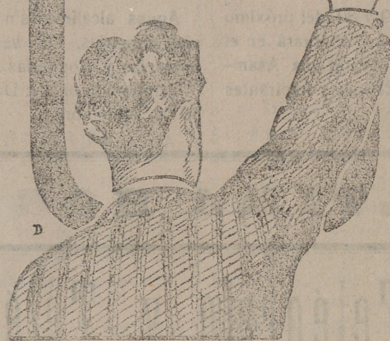
SE ENCONTRA EN FARMACIAS Y DROGUERIAS

y los Médicos le llaman el REMEDIO DE LOS DÉBILES