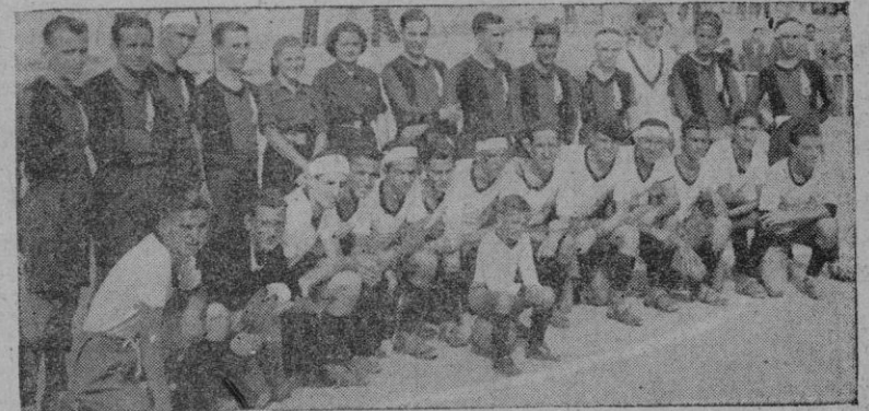
Los equipos de "Comercio" y "Gas y Electricidad", que jugaron ayer mañana el partido inaugural de la temporada deportiva de "Educación y Descanso"