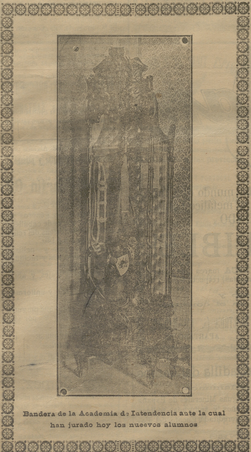
Bandera de la Academia de Intendencia ante la cual han jurado hoy los nuevos alumnos

También nos complacemos en testimoniar públicamente nuestro agradecimiento por las atenciones dispensadas á los representantes de este periódico.