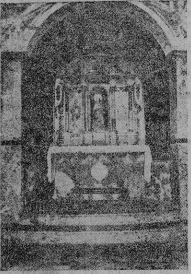
Señora del Refugio