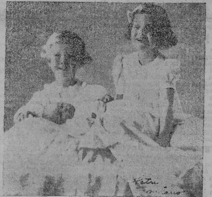
Los hijos de los Príncipes de Piemonte

Así se explica el creciente favor que a la "Historia de la Cruzada" dispensa el público que se ha dado cuenta de la magnitud del esfuerzo que se realiza y los revalida con su adhesión y con su apoyo.