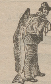
Obténase siempre la Emulsión con esta marca "El Pescador", marca del procedimiento Scott!

Cualquiera que sea el tiempo que ha estado V. tosiendo, la emulsión de SCOTT le cortará la tos. Nada le curará una tós con tanta rapidez y tan permanentemente como la de SCOTT. La Emulsión SCOTT es única en su clase. Supera de mucho á todas las emulsiones similares, en poder curativo. Compre esas y malgastará su dinero. Compre la de SCOTT y se curará Vd. Ninguna otra emulsión posee tan altas recomendaciones como la de SCOTT. En todas las droguerías y farmacias.